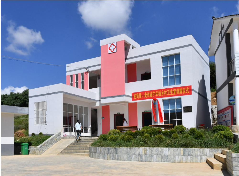
图 1 黑土河镇坪山村卫生室——幸福乡村卫生室 001 号

在幸福乡村卫生室项目全面推进的过程中，基金会与地方政府形成了“责任共担”的资金投入机制，采用了“上下协调、政社协同”的项目管理机制 4 （如图 2）。“责任共担”，即招商局慈善基金会和当地政府共同出资建设标准化村卫生室，其中基金会援助卫生室主体建设资金（标准化村卫生室 28.5 万元/所、中心村卫生室 56 万元/所），威宁卫健委承担附属设施和设备配套资金（标准化村卫生室 10 万元/所、中心村卫生室 15 万元/所）。基金会与威宁县人民政府协商成立了卫生室项目专项工作领导小组，促成了涵盖县-乡-村多层次、县卫健局、乡村振兴局等跨部门的项目管理运作模式。项目执行从上至下协调到位、压实责任，信息沟通从下至上及时反馈，确保项目顺利落地，迅速解决问题。威宁县人民政府以卫健局作为牵头实施单位，设立项目办，制定并落实项目实施计划。招商局慈善基金会作为资源平台，链接企业、社会组织等资源，不断优化项目设计、进一步配套村医培训，全方位支持项目提质增效。