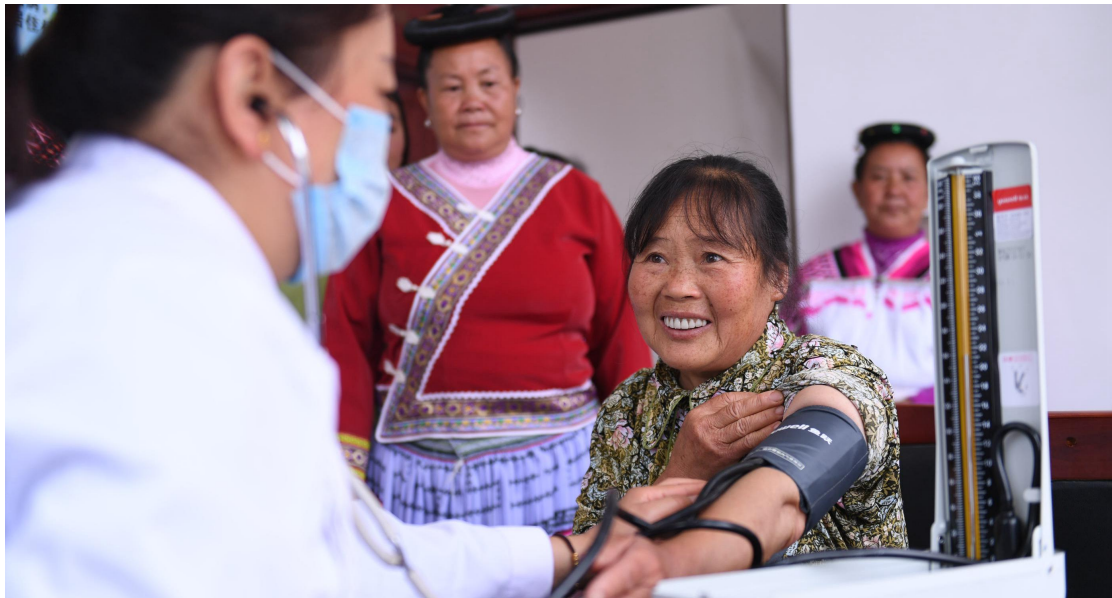
图 6 村民到村卫生室就医及进行健康监测

标准化建设的乡村卫生室，每个村卫生室设施齐全，功能完备，分为诊室、治疗室、药房、观察室，日常配备药品达 80 种以上，村民不用出村就能解决常见病诊治和常用药拿取等问题，基本能够满足当地群众的日常就医需求。同时，标准化乡村卫生室也提升了乡村医生的工作规范性，极大改善了村民的就医体验。以前村民去看病可能遇不到村医，无法就医，现在村医固定上下班，卫生室门牌明确显示村医去向，村民可随时就医、有效就医，真正实现了“小病不出村”。