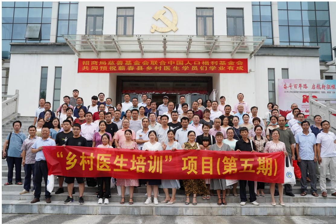
图 4 蕲春乡村医生培训