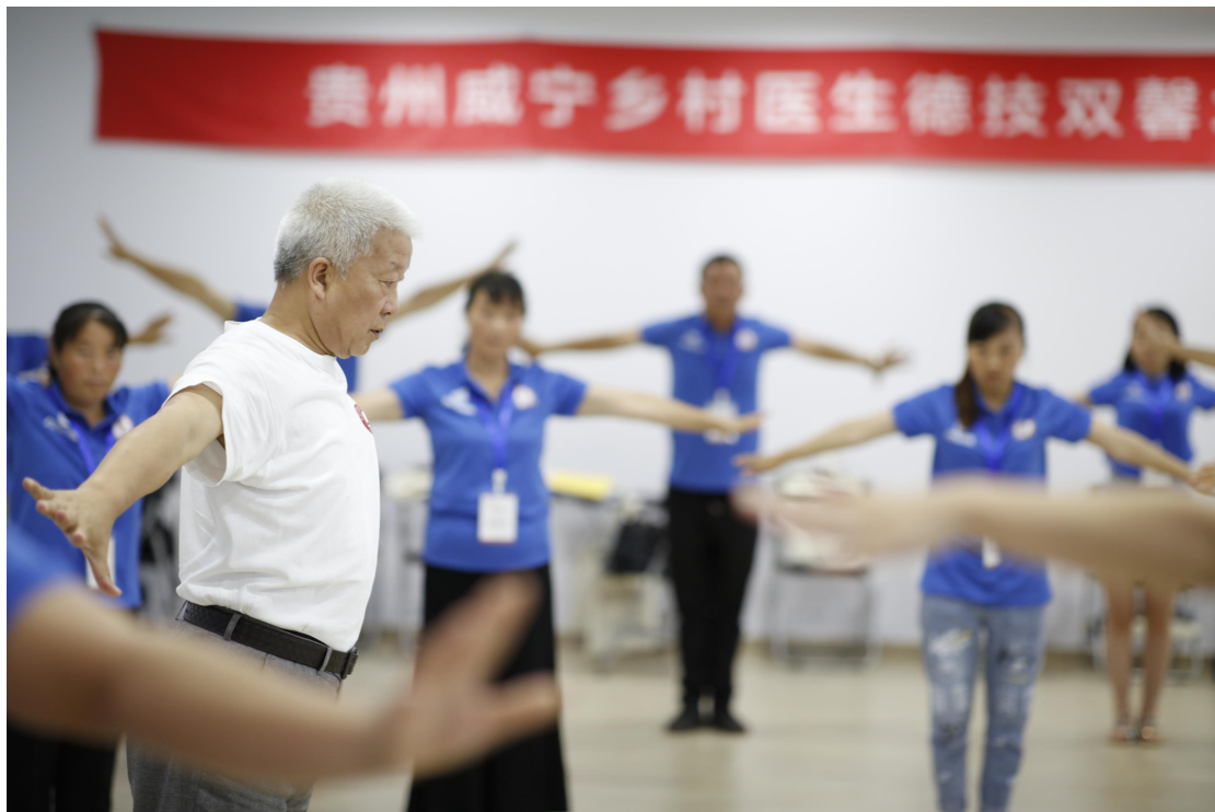
图 3 威宁乡村医生学习中医导引术

另一方面，基金会加强“医防结合”，尤其针对特殊人群（如孕产妇、儿童）的健康管理，以及健康行为和健康意识的培育，与世界宣明会合作，在威宁县开展“儿童卫生改善综合项目”，在当地学校开展健康教育，并为威宁陕桥社区卫生服务中心村医开展儿童常见病诊治培训；与中国人口福利基金会合作，实施“救助唇腭裂儿童”、“母婴安全计划”等项目，救治农村家庭唇腭裂患儿，为困难家庭发放装有新生儿必备物资和育儿手册的“宝贝箱”，培训村医普及优生优育知识，有效降低了儿童的发病率。